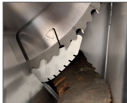
Der Niederhalter verhindert ein Verdrehen des Holzes.