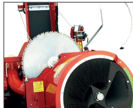
Ein Sägeblattwechsel ist ohne großen Aufwand möglich. Das Sägeblatt ist leicht zugänglich.

Gutschein für Kursteilnahme „Professionelles Arbeiten mit der Trommelsäge“