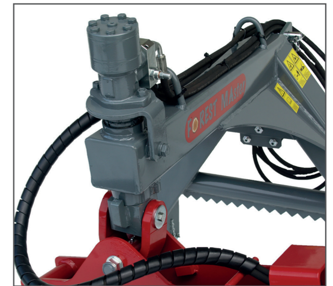
Rückezange RZ 165-D