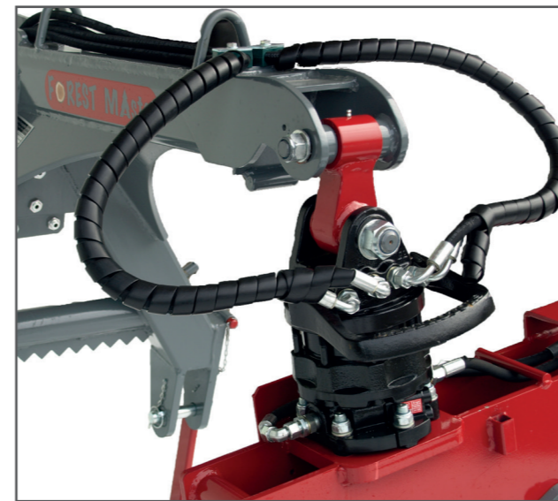
Rückezange RZ 165-R